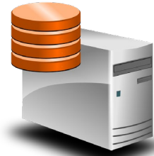
Eigener MailStore Archiv Server